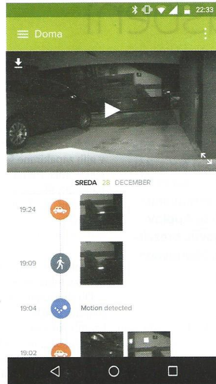
△ Prikaz dogajanja s časovnico

Netatmo Presence kaže smer, v katero gredo pametne kamere – zanesljivo prepoznavanje in aktivno delovanje. Verjetno bo umetna inteligenca v kratkem omogočila tudi hitro prepoznavo identitete posameznikov, kar bi omogočilo še boljše povzetenje dogajanj, recimo: »Obiskal vas je poštar in sosed vam je potacal travo.« A morda bo tole kljub vsemu korak preveč. ▶